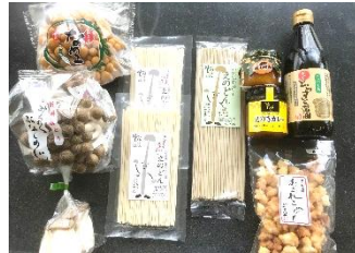
Bセット（きのこ乾麺セット）