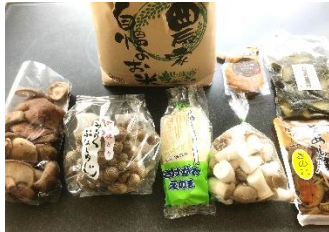
Aセット（村産米セット）