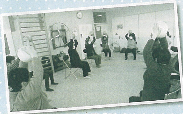
※感染予防に気をつけながら行っています。